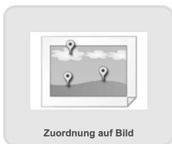
Zuordnung auf Bild

Kurzbeschreibung: Auf einem Bild müssen einzelne Bildpunkte benannt werden.