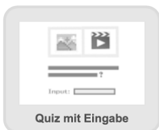
Quiz mit Eingabe

Kurzbeschreibung: Eine weitere Quiz-Möglichkeit mit der Besonderheit, dass hier keine Antwortoptionen vorgegeben sind. Die Schüler*innen müssen die Antwort in einem Textfeld eingeben.